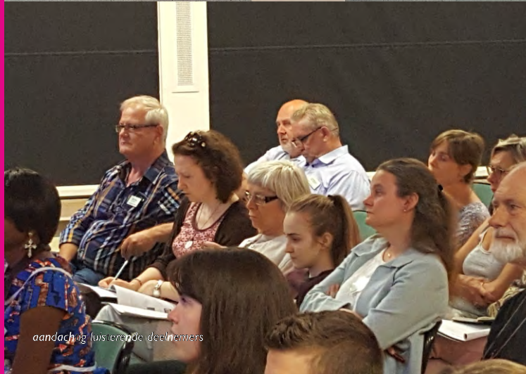
aandachtig luisterende deelnemers