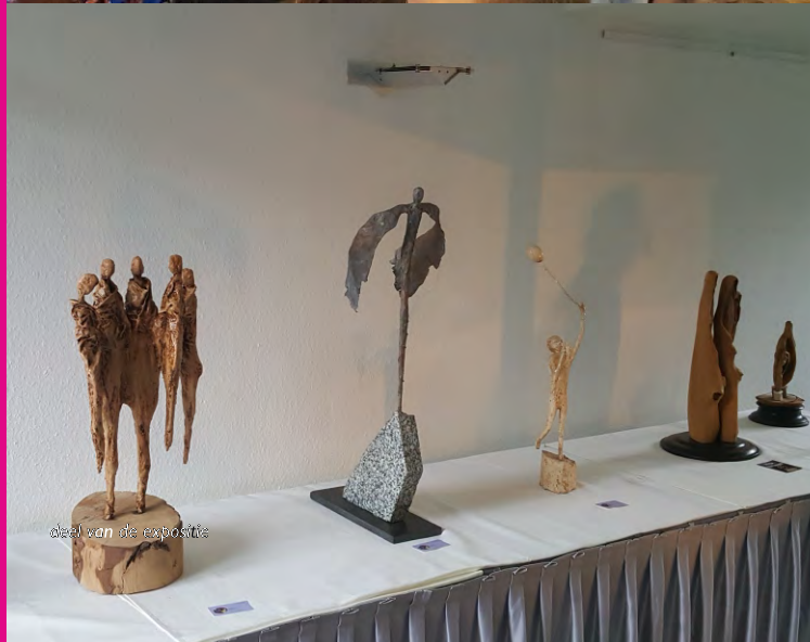
deel van de expositie