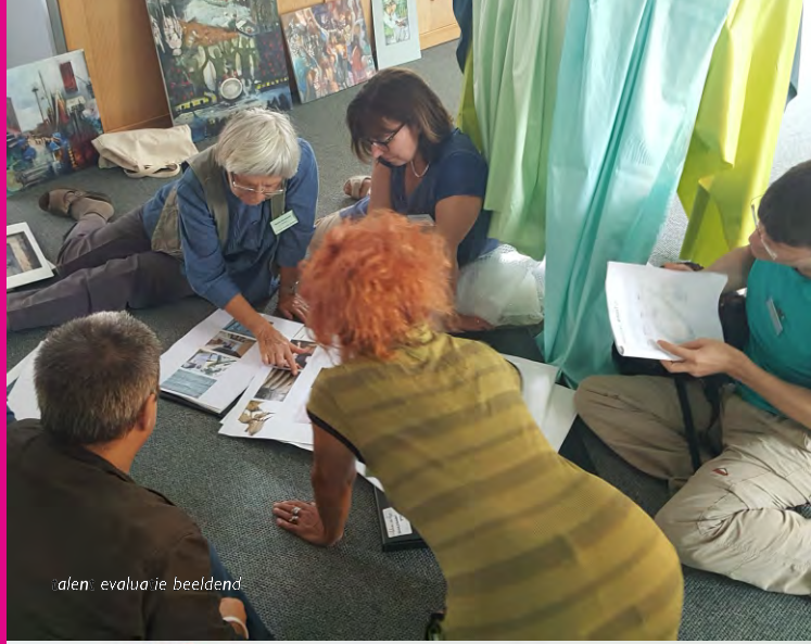
alen evalua ie beeldend